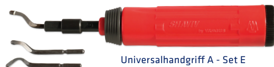
Universalhandgriff A - Set E